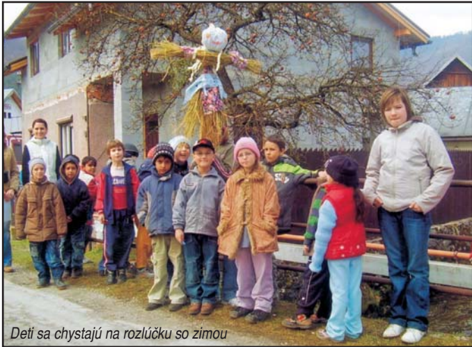
Deti sa chystajú na rozlúčku so zimou

Jar je symbolom začiatku nového života. Pučia stromy, rozkvitajú prvé kvety, liahu sa mláďatká. Aj v ŠKD vládla pravá veľkonočná atmosféra: trieda vyzdobená prácami detí, ne-