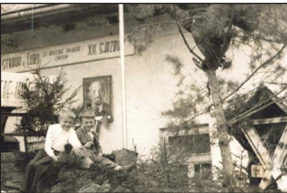
Súčasťou prvomájových osláv v minulosti, ktorých sa zúčastňovali aj malí školáci, boli tzv. alegorické vozy. Muránčania sa radi zviditeľňovali imitáciou lesa vo všetkých jeho podobách. Ihličnaté prostredie s vypchatým huňatým mackom sa prihováralo manifestujúcim transparentom s heslom: MURÁNSKE MEDVEDE – NAŠE DETI. Na zábere v pozadí vyzdobená budova bývalej Lesnej správy v Muráni (teraz „Kršma po hradom“).