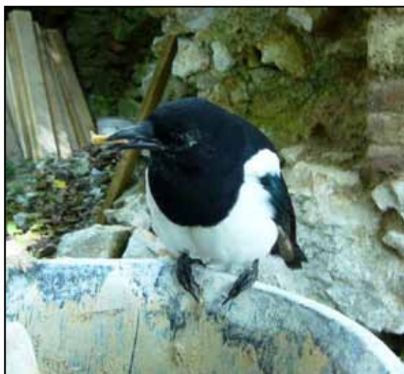
Nakoniec vyjadria spokojnosť s postupom prác a stihli sme ešte podebatovať pri cigaretky