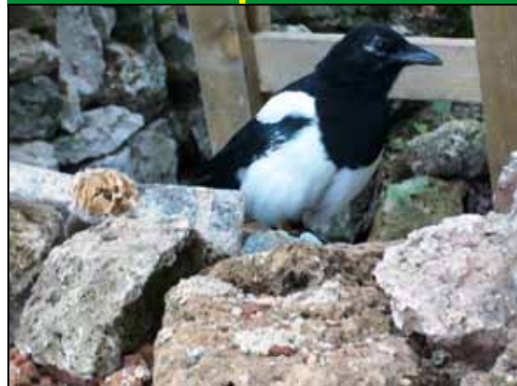
Pamiatková inšpekcia na hrade