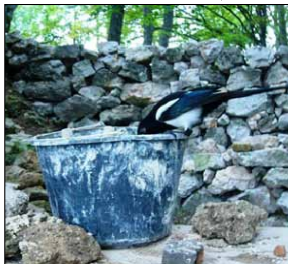
Najprv skontrolovala kvalitu malty