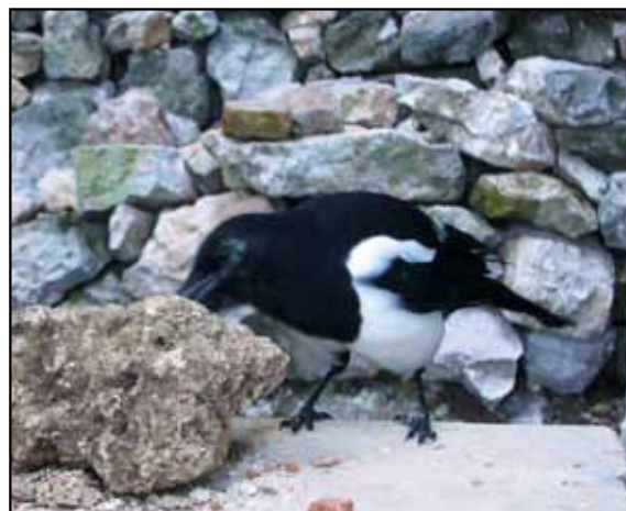
Potom sa zaujímal o materiál a stavebné postupy pri sanácii klenby