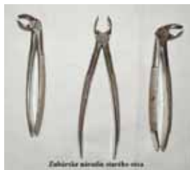
Zubárske kliešte starého otca

Premien v Muráni je neúrekom, ale výraznejšie ich postrehnú najmä bývalí občania, keď svoju rodnú obec navštívia po dlhšom čase. Cestou z Tisovca do Muráňa návštevníkom okamžite osloví neprehliadnuteľný penzión Lykovec a novovybudovaná predajňa potravín. Cestou vľavo do prírody malebnej Hrdzavej doliny možno pookrieť aj v tzv. zóne oddychu, ktorú svojpomocne vytvorili členovia ZO Jednoty dôchodcov v Muráni.