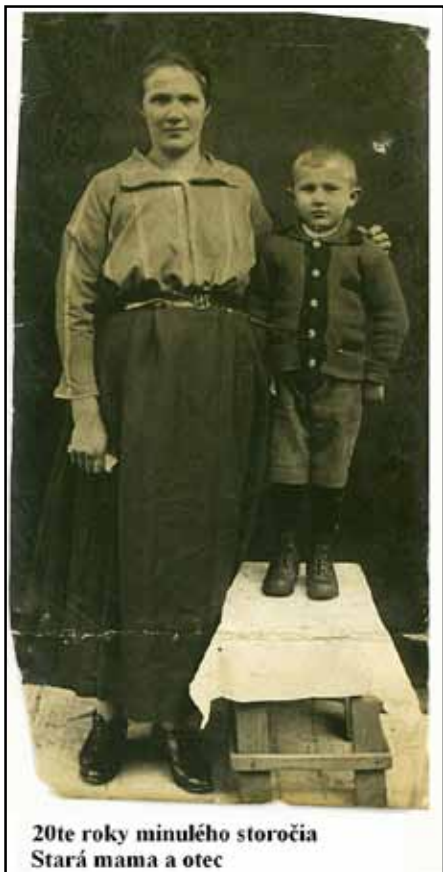
20te roky minulého storočia Stará mama a otec