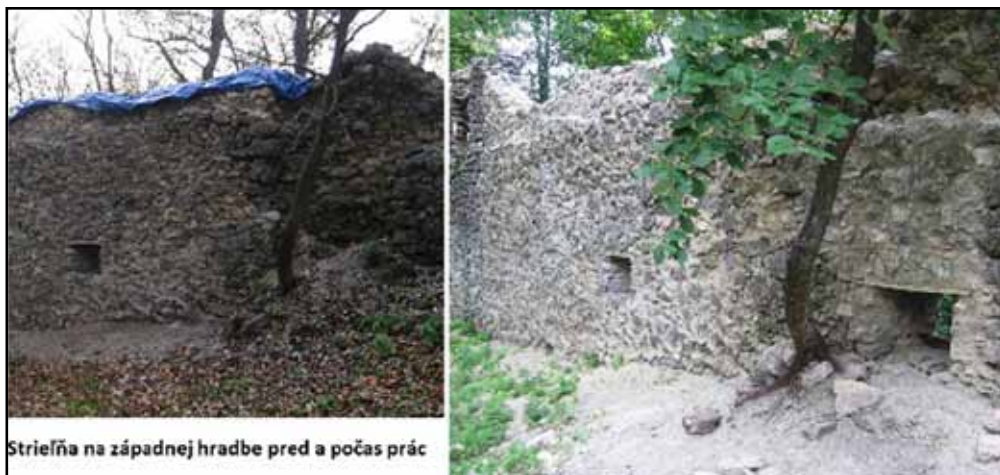
Strieľňa na západnej hradbe pred a počas prác