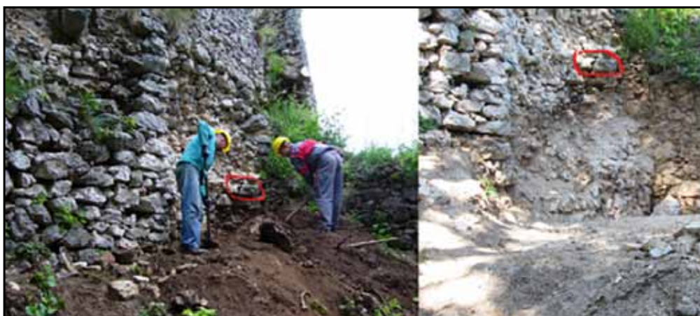
Odstraňovanie sutiny k päte múru s kavernou