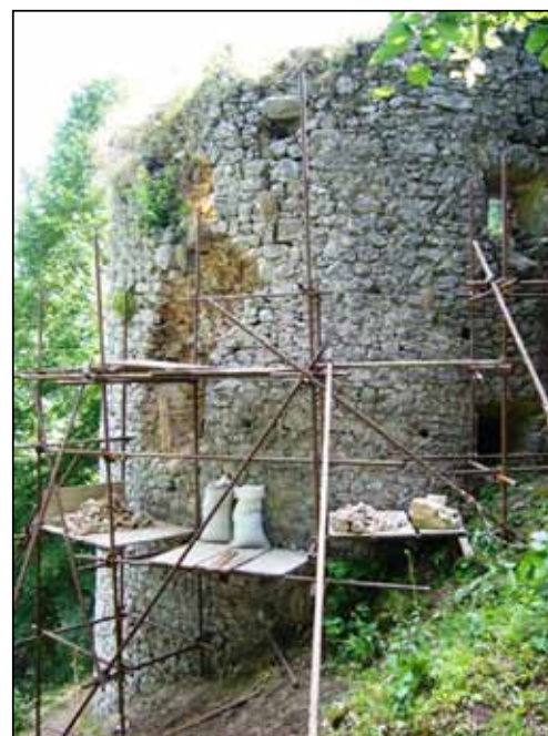
Príprava pred murárskym zásahom na Poludňovej bašte