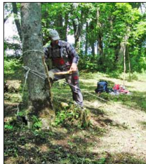
Hradný pomocník – „klčovrátok“