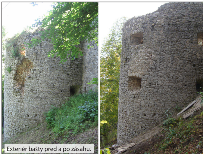
Exteriér bašty pred a po zásahu.