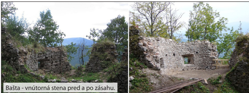
Bašta - vnútorná stena pred a po zásahu.

Na exteriérovej strane bašty sa rekonštruovali dve delové strelne a vyplnila sa kaverna medzi nimi. Z vnútornej strany sa doplnilo líčne murivo vrátane záklenkov stielni. Najväčšia pozornosť sa venovala komplexnej sanácii koruny múru. Práce pozostávali z rozobratia uvoľneného a vegetáciou prerasteného muriva, kde miestami táto deštrukcia mala výškový rozsah viac ako pol metra, následného domurovania a aplikácie ochrannnej vegetatívnej vrstvy. Obnova bašty konzervačnou metódou bola ukončená hĺbkovým výškárovaním vnútorného plášťa.