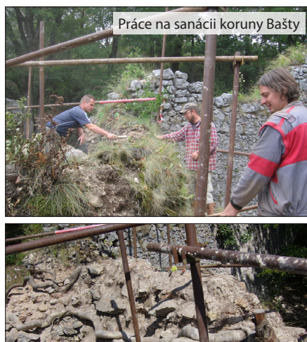
Práce na sanácii koruny Bašty