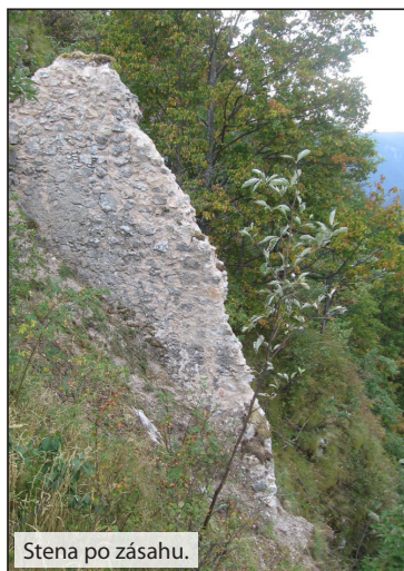
Stena po zásahu.