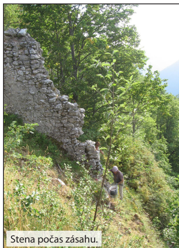
Stena počas zásahu.