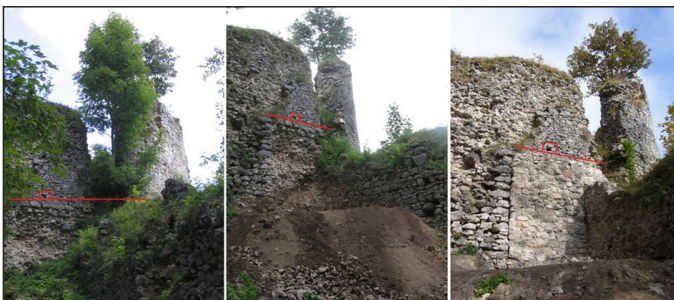
Fotografia z roku 2013 2015 pred murárskym zásahom 2015 po zásahu

Kaverna v exteriérovej časti Protitureckého bastiónu, tzv. Vážnice. Najprv bolo nutné odkryť a vyčistiť celý rozsah deštrukcie. Po stanovení návrhu obnovy metodikom sa vymurovala kaverna na škáru bez previazania a sanovala sa časť prislúchajúcej časti hradby.