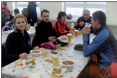
Pri guláši v jedálni ZŠ bolo o čom rozprávať.