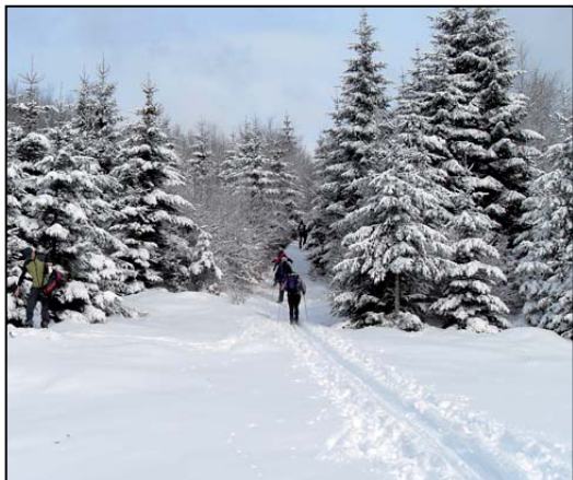
Biela idyla na ceste cez Strapačku