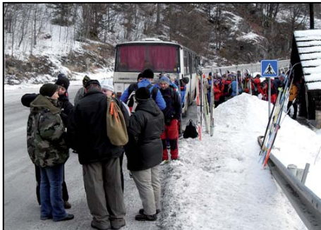
Aj to sa stáva, pokazený autobus s lyžiarmi skončil na M. Hute.