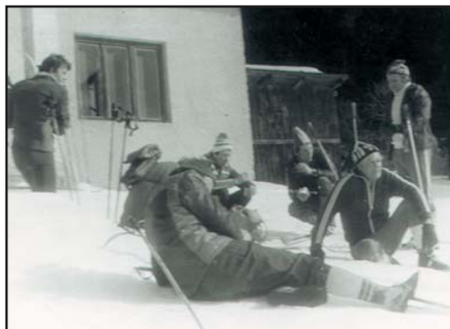
FOTO: Unavení chlapi pred chatou na Havranom.