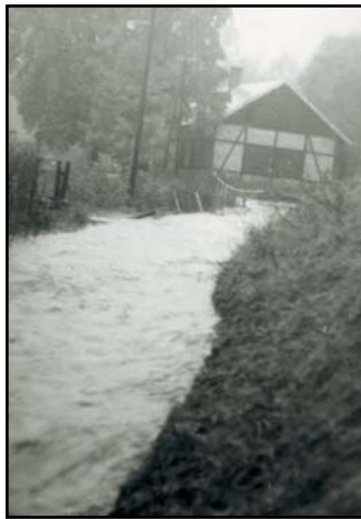
FOTO 1, 2. Na záberoch povodeň v Muráni v roku 1974 (Hrdzavé a píla). Naša Muránka sa zmenila na bezbrehý živel.