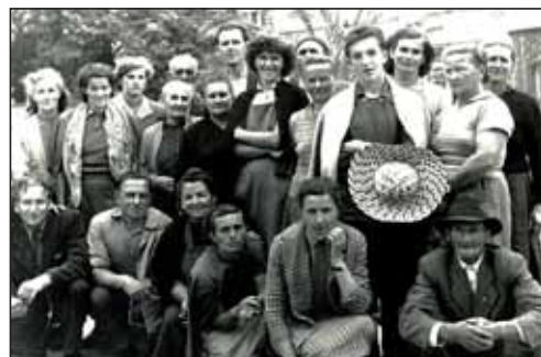
Pracovníci píly pred rokom 1989 v čase svojho relaxu na spoločnom výlete.