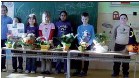
Ikebany z plodov jesene, veselé tekvičky a šikovné detičky