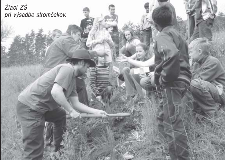
Žiaci ZŠ pri výsadbe stromčekov.