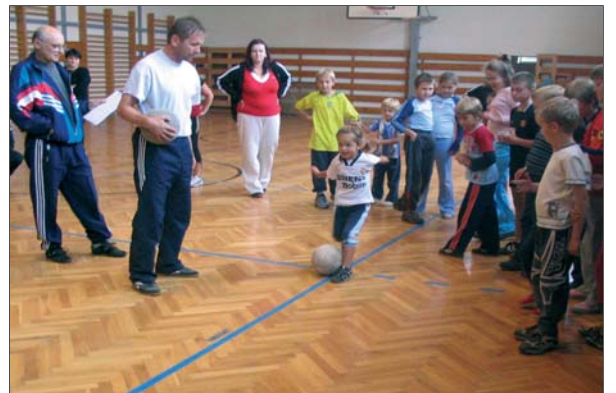
FOTO : Srdcovou záležitosťou starostu obce vo voľnom čase je šport, k čomu excelentne motivuje aj muránske deti a mládež.