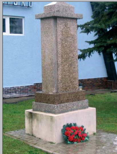
Pamätník padlých na námestí v Muráni.

Bolo to už veľmi dávno, malé chlapča som len bolo, no z tých vtedy vojnových čias čo to v mysli ostalo. V 44. roku hrozná vojna ešte tuho zúrila, a všetkých ľudí ver, priveľmi ničila. Okupant ovládal snáď celú Európu, slobode vyzváňal umierak do hrobu. Tu bystrický rozhlas "Mor ho!" rázne zvolal, a všetkých statočných do zbrane povolal. A čo i dušu dáš v tom boji divokom, mor ty len a voľ nebyť ako byť otrokom. Takto on zavlel, do boja burcoval, by ľud nepriateľa z vlasti svojej vyhnal. Muráň ten náš slávny nestal vtedy bokom, postavil sa rázne voči svojim sokom. Letisko zbudoval tu hľa na planine, bojových sokolov železných s pilotmi ono si privinie. Veď partizánov treba do boja vystrojiť i na tuhú zimu dobre ich pripraviť. Nepriateľ tu, na námestí, guľomet nachystal, by tých švárnych chlapcov olovom rozsekal. Takmer každý občan chcel v boji pomáhať a veľa statočných pritom aj život dať. Takých čo chytili, kruto umučili, aj živého za autom po zemi vláčili. Jedného večera otcov nám zavreli, že im oni ničia mosty, zabitím hrozili. Ej veľa krvi, slz sloboda žiadala, to všetko tá ukrutná vojna si zobrala. Tu hľa na pomníku sú mená vyryté, tých, čo neprežili roky vojny kruté. Dnes im tu skladáme úctu a pietu i veniec červený za ich krv preliatu. Večná česť a sláva hrdinovia naši, nech už nikdy na pomníku nepribudnú ďalší. Aj pamätnú dosku na letisku máme, čo sa vtedy dialo, nech je všetkým známe.