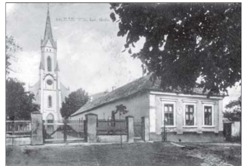
Rímskokatolícka škola medzi kostolom a farou.

Keď na Martina napadol sneh, tak sme robili snehuliakov a guľovali sme sa. Raz dostal do ucha guľu aj náš učiteľ. Nechal nás do večera po škole, ale sme mu ušli obkolo. Na Mikuláša býval v Muráni jarmok "Na placu" boli rozložené šiatre "s cukrami", hábami, hrnkami a šakovým inšim. Aj