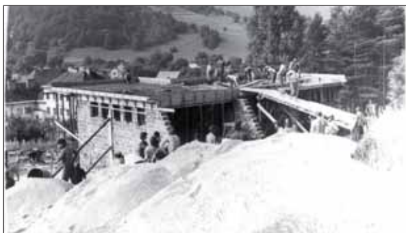
Dom smútku skolaudovaný v decembri 1980