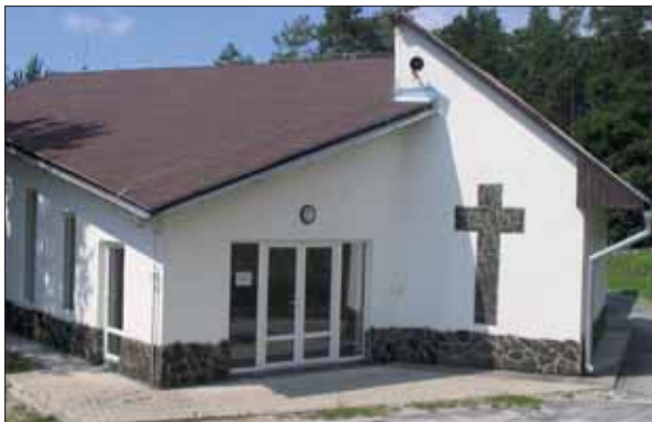
Dom smútku už v novom šate od roku 2007