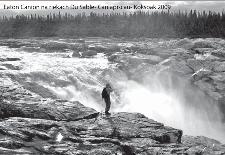
Eaton Canion na riekach Du Sable- Caniapiscou- Koksok 2009