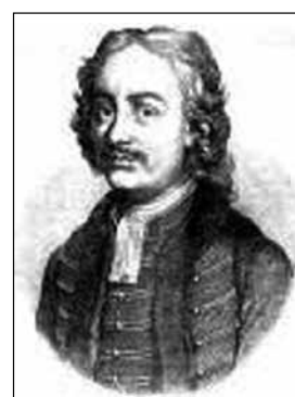
ŠTEFAN GYÖNGYÖSI (1629 – 1704)

Zalistovala som v niektorých regionálnych novinách a napr. v Štítnických zvestiach (č. 3, 2007, s. 12) uvádzajú, že na cintoríne v Štítniku sa v júli 2007 konal pietny akt pri príležitosti úmrtia významného barokového básnika, právnik a podžupana Štefana Gyöngyösiho (1629 – 1704). Akciu vtedy zorganizovala Spoločnosť maďarských spisovateľov na Slovensku. Autor príspevku uvádza, že študoval v Prešove a na kolégiu v Sárospatku, kde ho učil aj J. A. Komenký. Potom bol prísediacim súdnej tabule