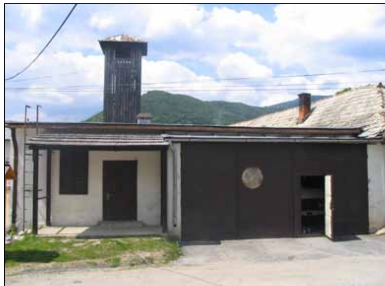
Pôvodná budova hasičskej zbrojnice