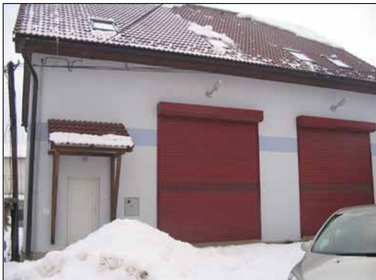
Nová budova hasičskej zbrojnice